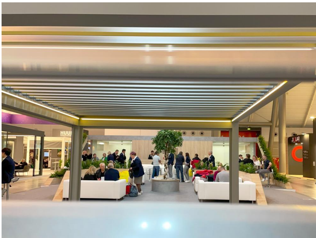
CLIMAX na veľtrhu R+T v Stuttgarte.

Tieniaca technika má svoj veľtrh. Ten tohtoročný R+T v Stuttgarte sa konal po 6-ročnej vynútenej pauze a my sme sa ho mohli konečne zúčastniť. Ak si niekto kladie otázku, čo zaujímavé sa vo svete tienenia deje, odpoveď je nasledujúca – nenápadný luxus, kvalita a ekologické inovácie.